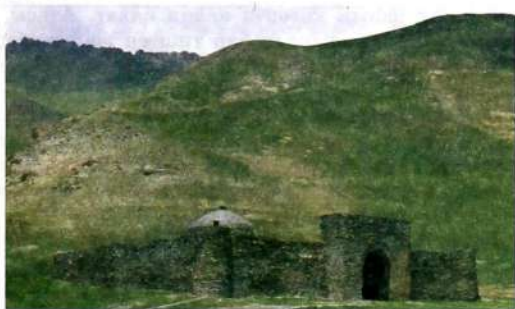
Таш-Рабат – Ат-Башы өрөөнүндө жайгашкан байыркы кербен сарай.

Рабат – кыргыз тилине которгондо «ажайып, кооз жай», таштан салынган кооз жай дегенди түшүндүрөт.