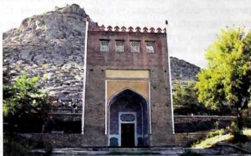
Сулайман тоосунда жайгашкан музей.

Дөөт падыша болуп турган кезде көп балдарынын ичинен Сулайманга тактысын калтырам деп убада берип, көзү өтө электе эле аны такка отургузган экен. Сулайман такка отурган соң Кудай таала ага аян берип: «Эмнени каалайсың? Кандай тилегиңди орундатайын» – дейт. Ошондо Сулайман «Оо жараткан эгем, мен алсыз карапайым адаммын, ушунча элдин үстүнөн падышачылык кылуу үчүн мага акылмандык бере көр» – деп суранат. Кудайга Сулаймандын тилеги жагып: «Сен душмандарыңдан кек алууну, байлыкты, мансапты, же керт башыңа керек пендечилик кызыкчылыкты сурабай акылмандыкты сурадың. Тилегиң орундалсын, байлык, атакданкты жана жан-жаныбардын тилин билүүчү касиетти сага кошуп бердим деген экен». Ошентип Сулайман падыша элге, жерге гана карамдуу болбой, жан-жаныбарга да карамдуу падыша болуптур. Ал падышачылыгында эмне болгонун өз көзү менен көрүп туруу максатында, тагын Улуу тоонун башына салдырып, күндө эртең менен айланасындагы адамдар, жан-жаныбарлар менен жана жашоонун башаты болгон Күн менен амандашып турчу экен. Күн сайын падышачылыгында эмне болуп жаткандыгынан кабар алчу. Бардык жан-жаныбардын